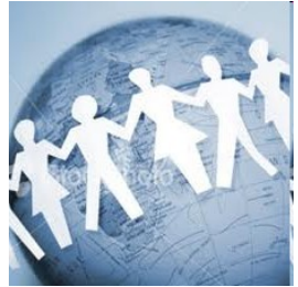
Lideranças comunitárias e religiosas