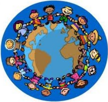
Órgãos e entidades de proteção às crianças, adolescentes e suas famílias