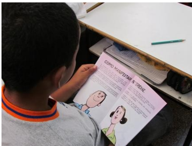
Atividade com a Cartilha na EM João Nepomuceno em Campo Grande (MS)