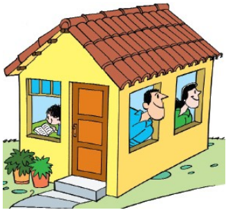
Vizinhos, amigos e colegas de trabalho